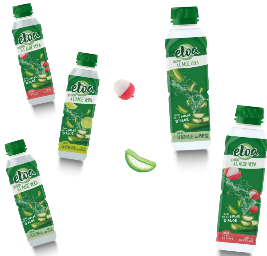
Format 500 ml