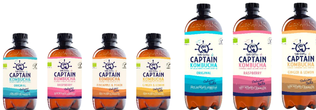
Format 400 ml