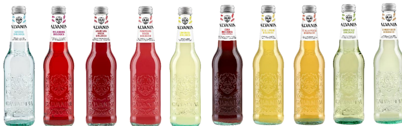
Format 355 ml