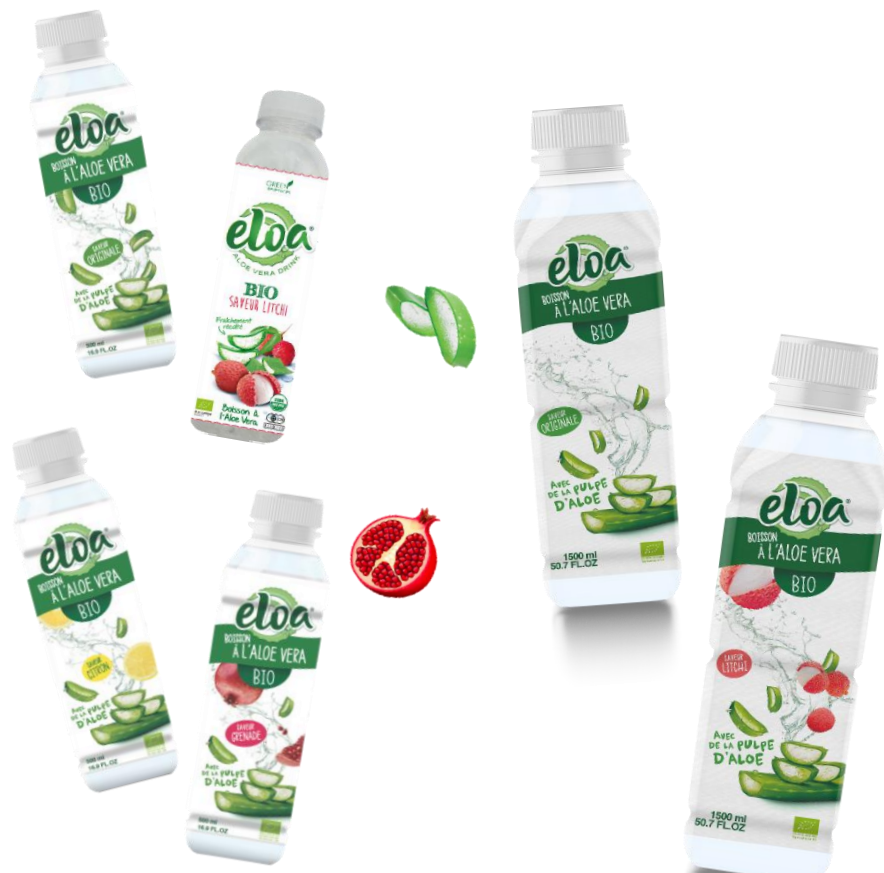
Format 500 ml